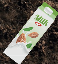
TETRABRIK 30 AÑOS