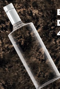
BOTELLAS DE VIDRIO 4.000 AÑOS