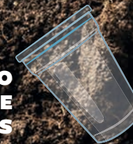
VASO DESECHABLE 1.000 AÑOS