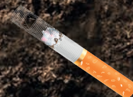
COLILLAS 10 AÑOS