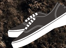
ZAPATILLAS 200 AÑOS