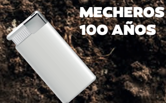
MECHEROS 100 AÑOS