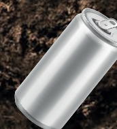
LATA ALUMINIO 10 AÑOS